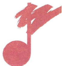
Leiter der Bischöflichen Kirchenmusikschule