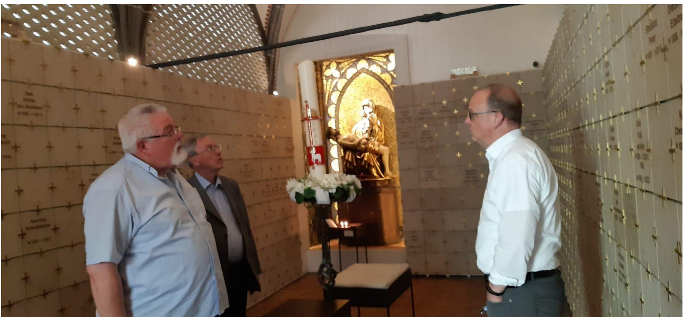
Besuch im Kolumbarium, das wesentlich auch auf Erfahrungen aus unserer Partnergemeinde St. Severi in Erfurt zurückgeht.